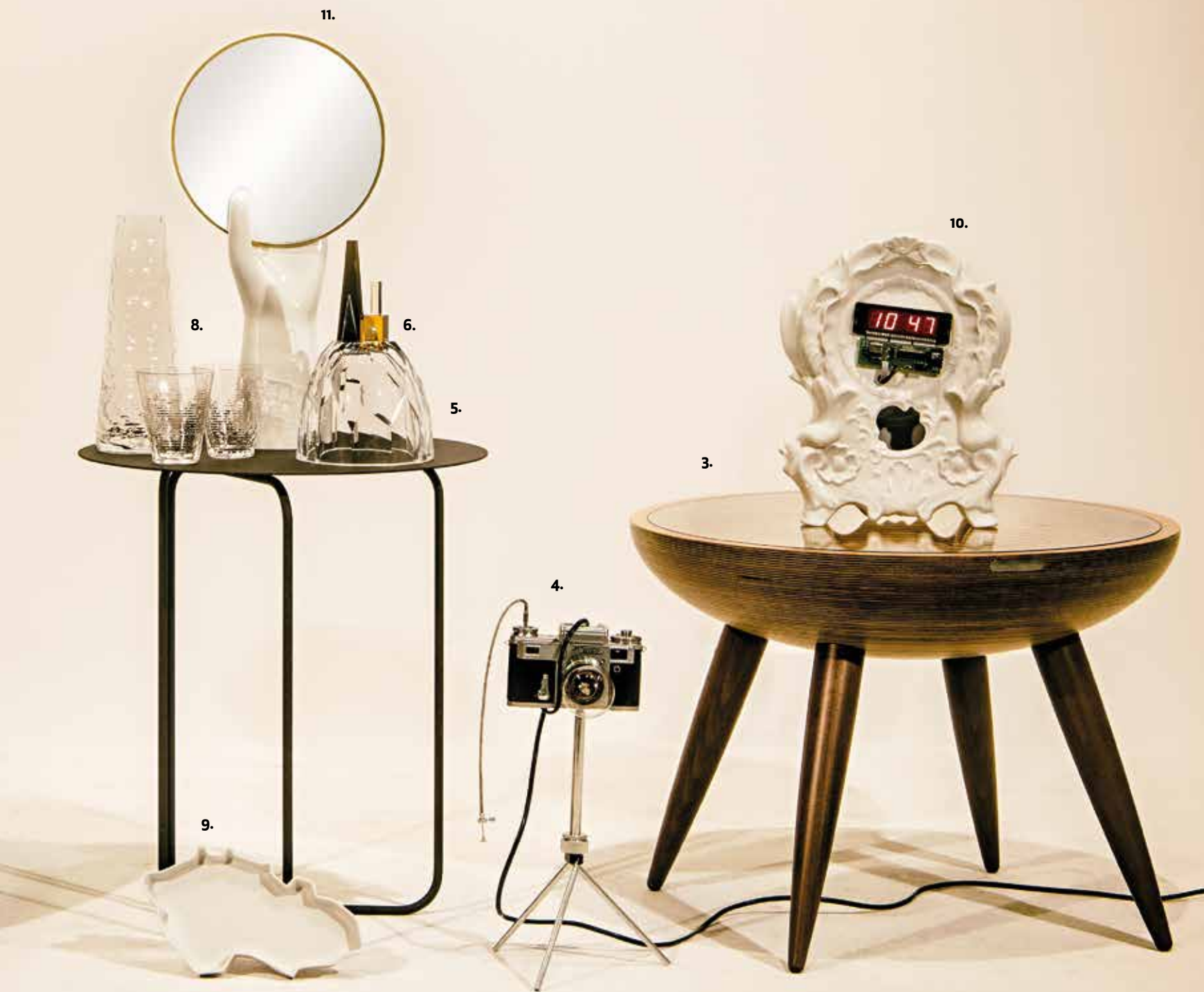
1. Klobouky Stop by Markéta Martišková ve spolupráci s Tonak , 8 700 Kč/ks 2. Taburetka Macarons , Helena Dařbujánová , 33 000 Kč 3. Stolek Makronky , Helena Dařbujánová , 38 000 Kč 4. Lampička Darwin , ateliér Fungl , 3 600 Kč 5. Stolek Flip , Klára Šumová a Dirk Wright , info o ceně na dotaz 6. Skleněný objekt Glass Mountain , DECHEM , 16 200 Kč 7. Boty, Petra Gabaš pro Flexiko , info o ceně u návrháře 8. Nápojová sada, studio P3L1 , 4 800 Kč 9. Porcelánový tácek Republic Tray , Maxim Velčovský , Qubus , 860 Kč 10. Hodiny Digi Clock White , Maxim Velčovský , Qubus , 9 200 Kč 11. Zrcadlo Hände hoch! , Jakub Berdych , Qubus , 22 000 Kč